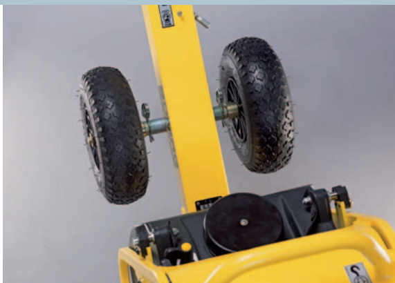
Транспортировочные колеса (опция): просты в эксплуатации...