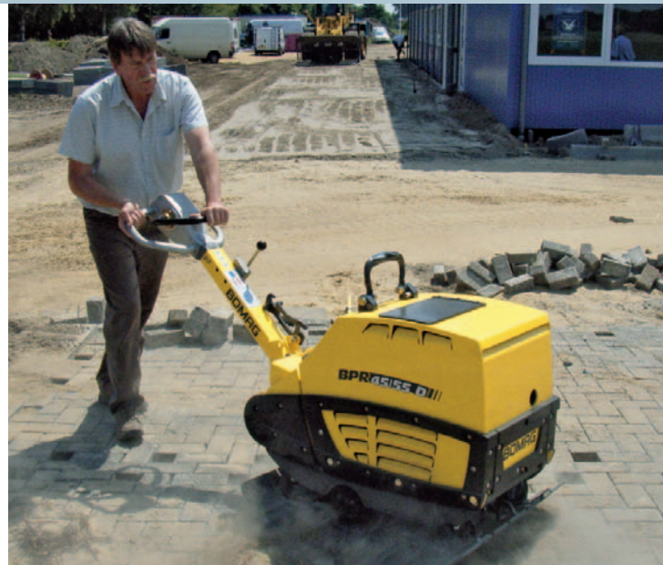
С ковриком из синтетического материала (опция) эти модели особенно хорошо подходят для мостовых работ.