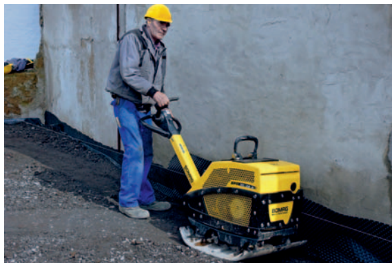
BPR 35/60D с полностью защитным кожухом (опция) для максимальной защиты от повреждений.