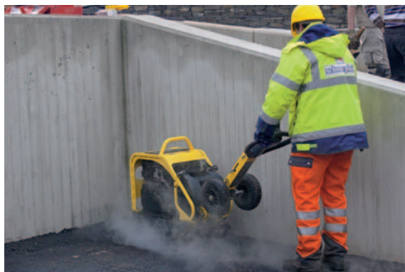
...для использования на асфальте.