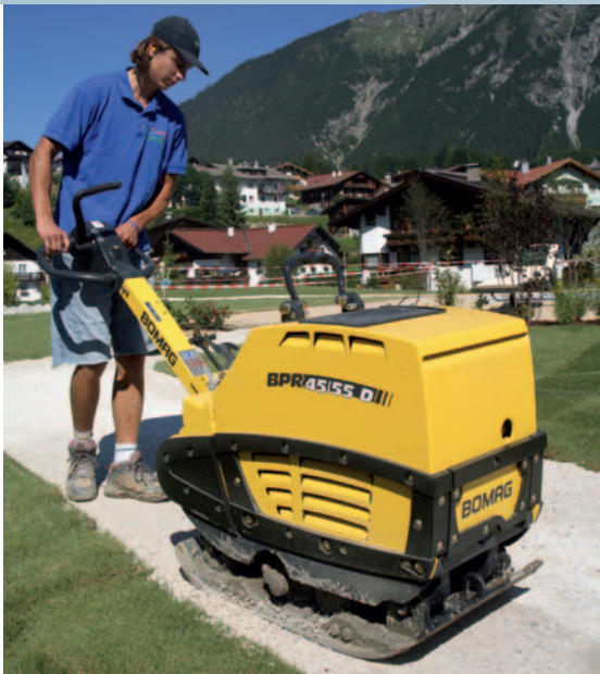
Универсальные машины для разнообразного применения.