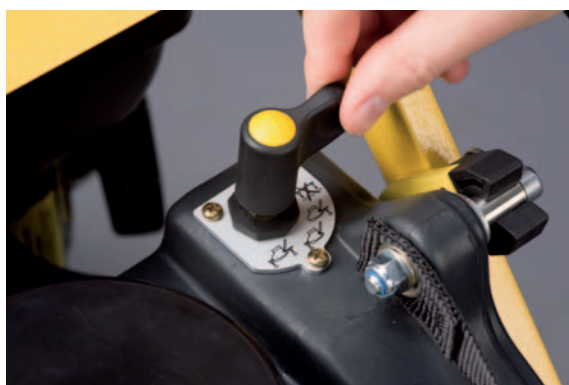
Система орошения (опция): обеспечивает простое и точное дозирование расхода воды...

максимальную защиту машины от вандализма, в то же время обеспечивает доступность всех компонентов машины.