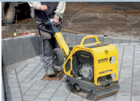
...и всегда готовы к эксплуатации.