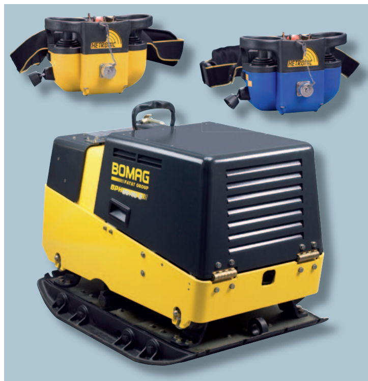
BPH 80/65S – с дистанционным управлением для максимальной безопасности оператора.