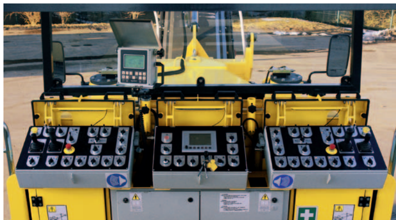
Интуитивная концепция управления.