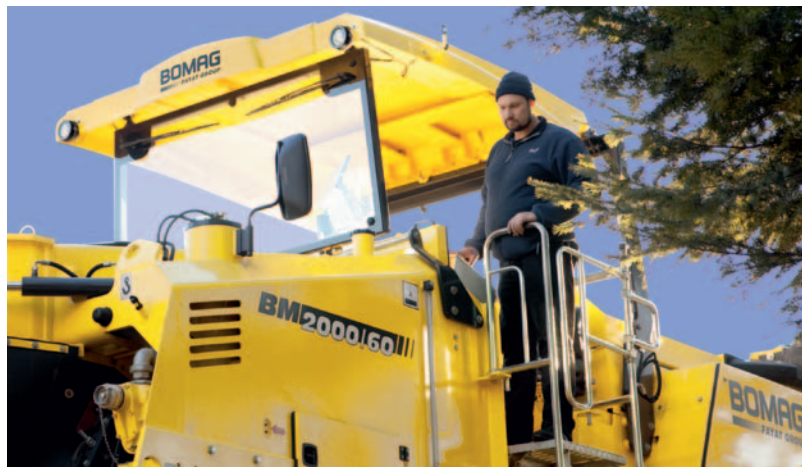
Препятствия? Просто сместитесь в сторону.