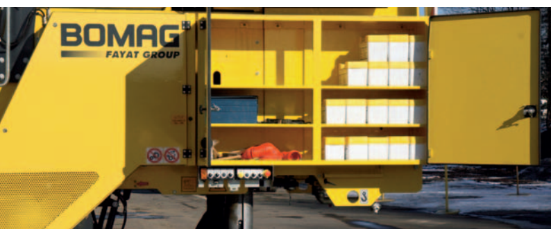
Большие отсеки для принадлежностей.