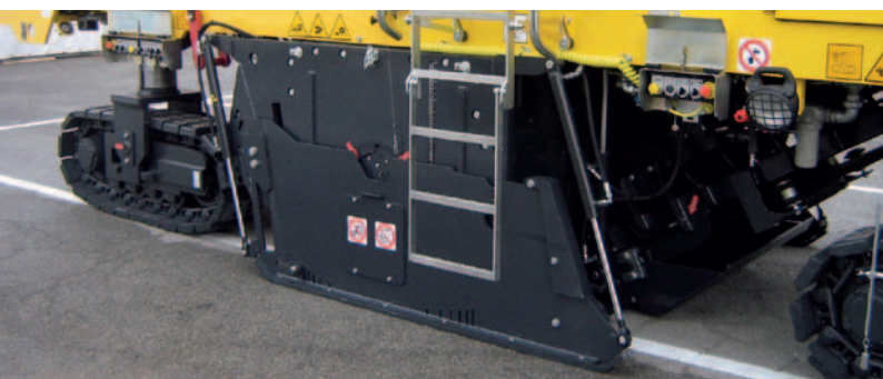
Гидравлические боковые щиты.

Комфорт и безопасность. Новые отсеки большой вместимостью послужат вам в качестве дополнительного “багажника” для быстроизнашиваемых деталей, инструмента и личных вещей, доступ к которым возможен с земли.